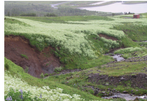
Skógarkerfill í gömlum túnnum og graslendisbökkum á Mógilsá á Kjalarnesi. 17. júní 2003.

Upplýsingar um skógarkerfil er að finna á vef Náttúrufræðistofnunar Íslands.