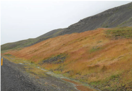
Uppgrætt svæði við nýjan veg á Vestfjörðum. Ljós. Borgþór Magnússon, 28. ágúst 2012.