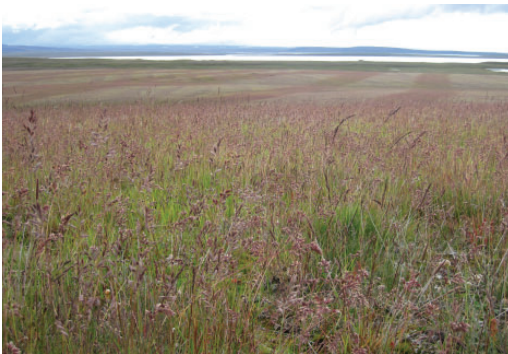
Uppgræðslusvæði á Safnási við Blöndulón. Ljós. Járngerður Grétarsdóttir, 23. ágúst 2015.

Í einhverjum mæli um allt land en mest á mela-, sanda- og uppblásturssvæðum landsins þar sem landgræðsla er stunduð, svo sem í Árnassýslu, Rangárvallasýslu, Skaftafellssýslum, Suður-Þingeyjarsýslu og á hálendinu við Blöndulón og Hálslón.