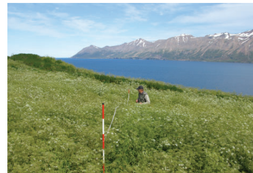
Breiða af skógarkerfli í Hrísey á Eyjafirði. Ljós. Borgþór Magnússon, 11. ágúst 2011.