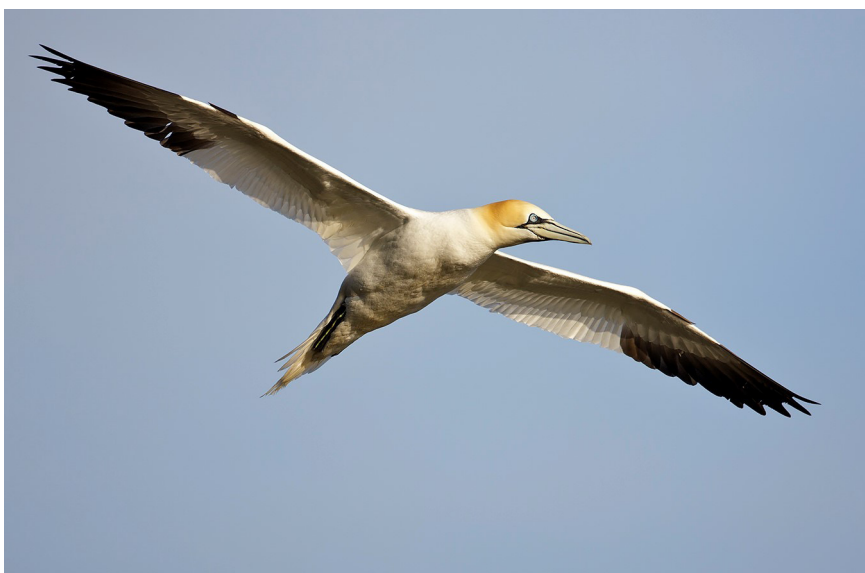
1. mynd. Súla Morus bassanus við Skoruvíkurbjarg á Langanesi, 23. maí 2008. – Daníel Bergmann.

Alls voru talin súlusetur 37.216 á árunum 2013-2014 (1. tafla). Síðast var súlan talin hér 2006 (Vestmannaeyjar og Eldey) og 2008 (Austurland). Þá fundust samtals 31.529 setur og höfðu því 5687 setur bæst við á um sex árum sem er 18% aukning og svarar nokkurn veginn til 3% fjölgunar á hverju ári frá síðustu talningu. Sunnanlands hélt áfram að fjölga í Vestmannaeyjum en þar voru nú 15.044 setur alls, tæpum 3000 fleiri en vorið 2008 og samsvarar það um 2% árlegri fjölgun sem var aðallega í Súlnaskeri (alls 2800 ný setur eða 4,7% á ári) og einnig í Geldungi (342, 2,5% á ári). Í Eldey var næstum sami fjöldi setra, 14.810, árið 2013 og 2006. Þar hefur fjöldinn lítið breyst í 30 ár. Austanlands fjölgaði um næstum jafnmörg setur eins og sunnanlands, eða um 2700 setur, en hlutfallsleg aukning var mun meiri eða 7,7% á ári. Fjölgunin var sem fyrr langmest í Skrudnum,