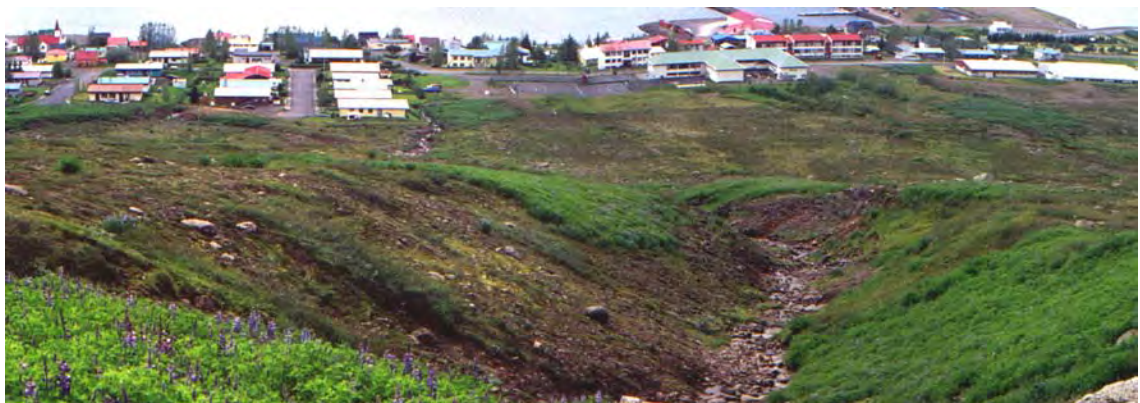
Mynd 1: Séð niður farveg Nýjabæjarlækjar (farvegur 15) í hlíðinni ofan við Búðir í Fáskrúðsfirði. Myndin gefur hugmynd um stærð farvegarins og krapamagn sem hann getur safnað í sig..

Möguleikar eru á krapasöfnun í nokkrum farvegum innar í hlíðinni (farvegir 7, 9 og 10, kort 3). Þeir eru allir svo grunnir að ekki er ástæða til að búast við stórum krapaflóðum úr þeim (tafla 1). Vel má vera að krapaskotin sem getið var um hér að framan en ekki voru rakin til sérstakra lækja komi úr þessum farvegum.