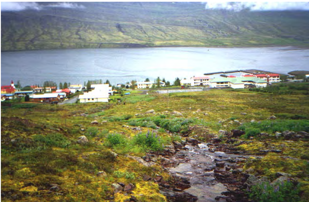
Mynd 2: Séð yfir skriðukeiluna við Nýjabæjarlæk sem í dag fellur niður eftir henni innan við Skólabrekku. Á myndinni má einnig greina þurran farveg sem fallið hefur eftir í átt að grunnskólalóðinni. Myndin er tekin úr gilkaftinum neðst í fjallshlíðinni.