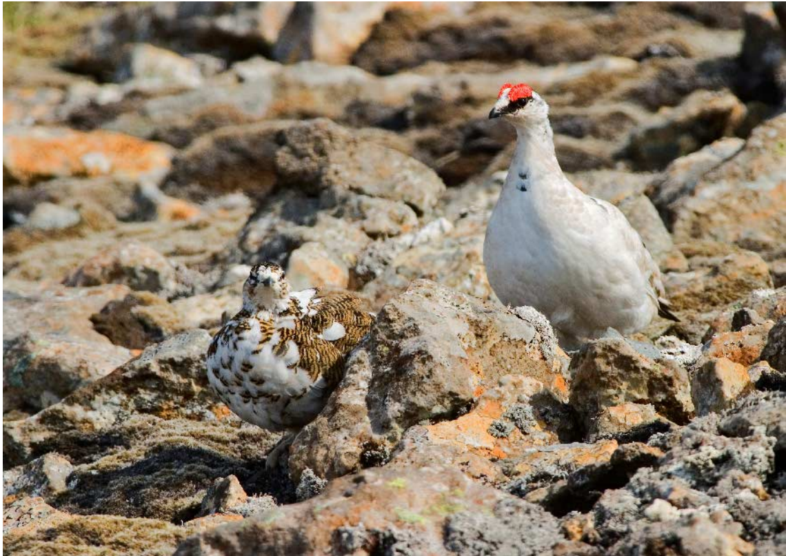
Rjúpupar, Látraheiði, Vestur-Barðastrandasýsla, 25. maí 2003.