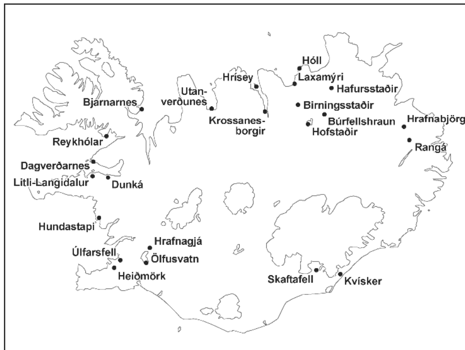
1. mynd. Rjúpnatalningareitir á Íslandi 2005. Ætlunin er að telja á öllum þessum reitum 2006.

Talningarnar fara þannig fram að hvert talningasvæði er heimsótt einu sinni á ári, venjulega í síðari hluta máí. Mælt er með að hvert svæði sé talið á sama hátt ár eftir ár, þannig að niðurstöðurnar séu sambærilegar milli ára. Þetta tekur meðal annars til þess hvenær talið er á vorin, einnig hvenær sólarhringsins menn telja en mælt er með að það sé gert annaðhvort snemma morguns (kl. 05:00–10:00) eða síðdegis (kl. 17:00–23:00). Þá skiptir máli hvernig svæðið er gengið, það er hvaða leiðir eru farnar og hve hratt er farið yfir. Við talninguna hafa menn yfirleitt notað kort eða loftmynd af svæðinu og merkt inná allar rjúpur sem sjást. Talningareitir voru 23 talsins og dreifðir í öllum landshlutum (1. mynd). Þrír talningareitir eru inn á hinu friðaða svæði á Suðvesturlandi. Ætlunin er að telja á öllum þessum reitum voruð 2006.