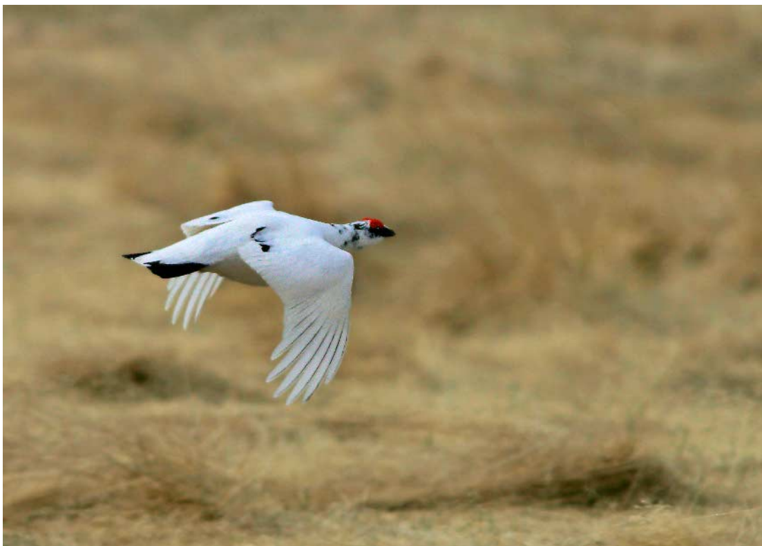
4. mynd. Rjúpukarri á flugi. Hægt er að aldursgreina fuglinn á lit handflugfjaðra númer tvö og þrjú (talið utan frá). Þetta er árgamall karri sem sést á því að handflugfjöður númer tvö er dekkri en númer þrjú. Fuglinn er kyngreindur á kömbum og svartri grímu. Snæfoksstaðir í Grímsnesi, 30. apríl 2005.