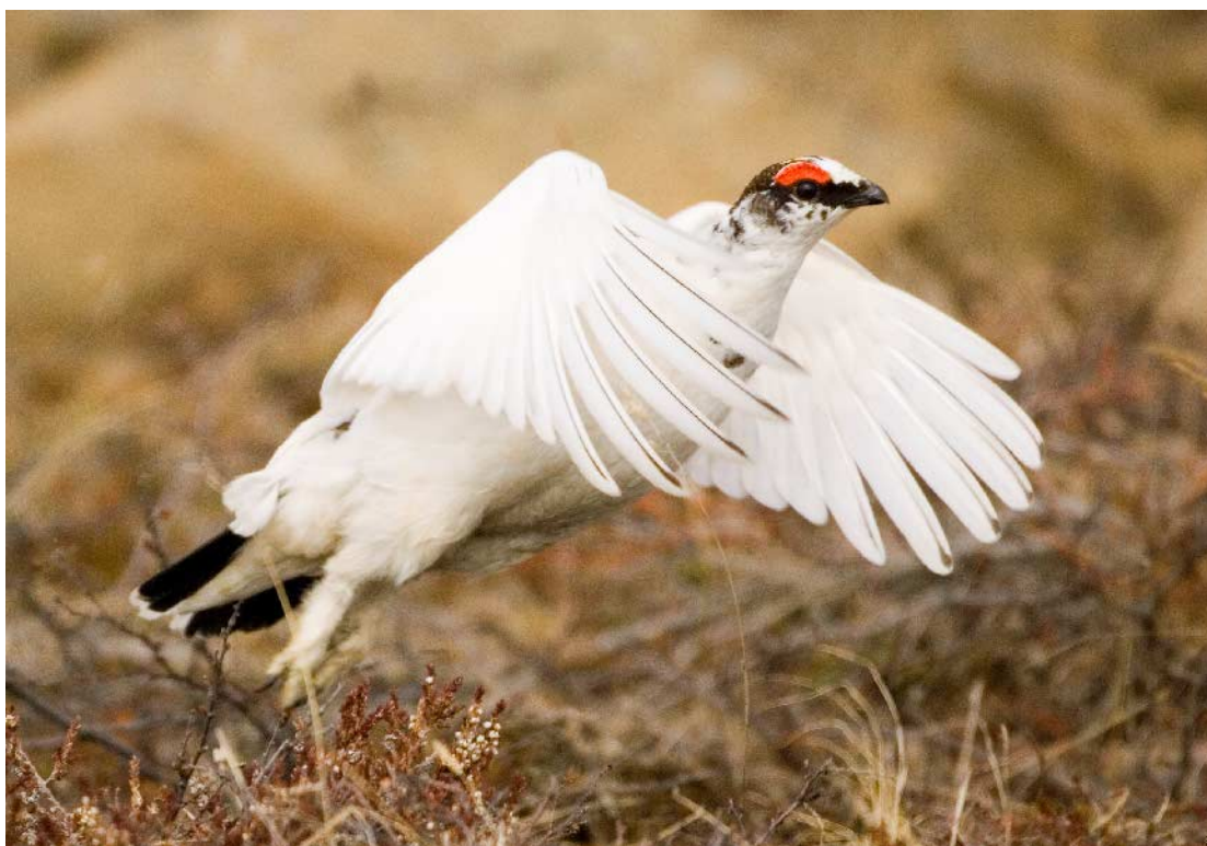
5. mynd. Tveggja ára gamall rjúpukarri eða eldri; handflugfjöður númer þrjú er dekkri en númer tvö. Mývatnssveit, 2005.