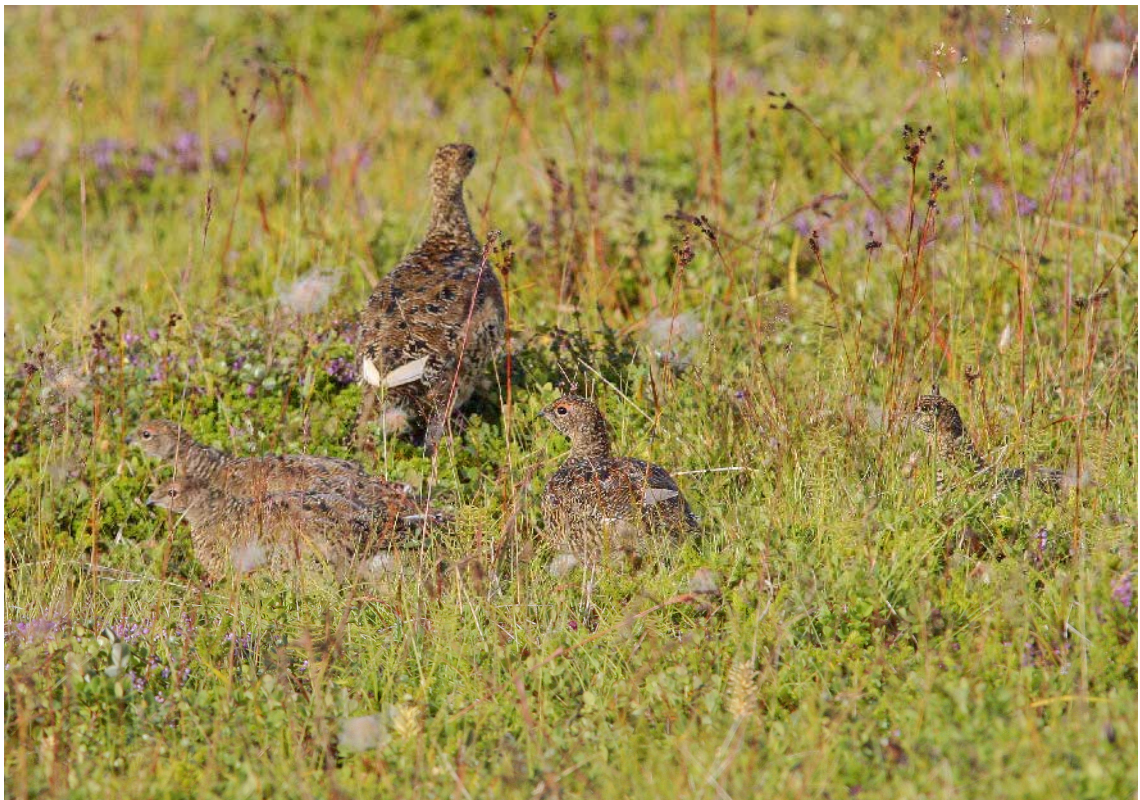
3. mynd. Stálpaðir rjúpuungar í forgrunni, fjögur stykki, móðirin fjær. Það er á þessu aldursskeiði sem aldurshlutföll eru tekin í rjúpnastofninum til að meta viðkomu. Ytri-Tunga, Tjörnesi, 5. ágúst 2004. Ljós. Jóhann Óli Hilmarsson

karra) fellur með aukinni fjarlægð frá sniðlínu (Buckland o.fl. 2001). Gert er ráð fyrir að dreifing fuglanna um rannsóknasvæðið ráðist af einhvers konar slembiferli. Til að fá óbjagað mat á þéttleika þarf á sama máta að nota handahófsreglu við að dreifa talningasniðum. Akvegir fullnægja fráleitt þessum skilyrðum og niðurstöðurnar endurspeglar því fyrst og fremst þéttleika rjúpna meðfram vegum. Tilgangurinn með þessum talningum er að fá samanburðarhæfa stofnvísitölu á milli ára með öryggismörkum fyrir hvert svæði. Miðað er við að breytingar á þéttleika rjúpna meðfram vegum í einhverri ákveðinni sveit séu í takt við það sem er að gerast í rjúpnastofninum á því landsvæði. Þessi forsenda hefur enn ekki verið prófuð en árið 2007 verða komnar 5 ára langar raðir fyrir tvö svæði þar sem bæði er beitt sniðtalningum og vegsniðum. Þá ættu að vera komin nægileg gögn til að bera saman niðurstöður þessara tveggja aðferða og svara því hvort það gengur upp að telja á vegsniðum. Eina ástæðan fyrir því að vegir eru notaðir, en ekki gengin snið valin með slembiferli, er tímasparnaður. Til að ná nægilega stóru úrtaki í mismunandi landshlutum þurfa sniðlínur að spanna samtals 1000–2000 km og ekki hefur verið önnur leið, miðað mannafla, en að nota vegsnið til að framkvæma þetta á þeim fjórum vikum sem hægt er að telja karra vor hvert.