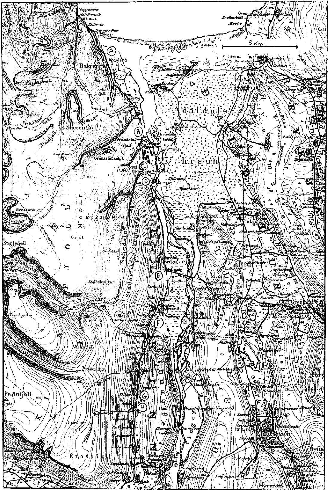
Mynd 1: Könnunarstaðir í Ljósavatnshreppi.