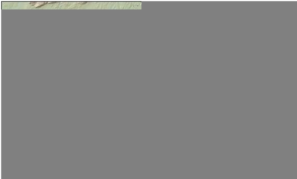
Mynd 1 Gróf staðsetning framkvæmdasvæðis.